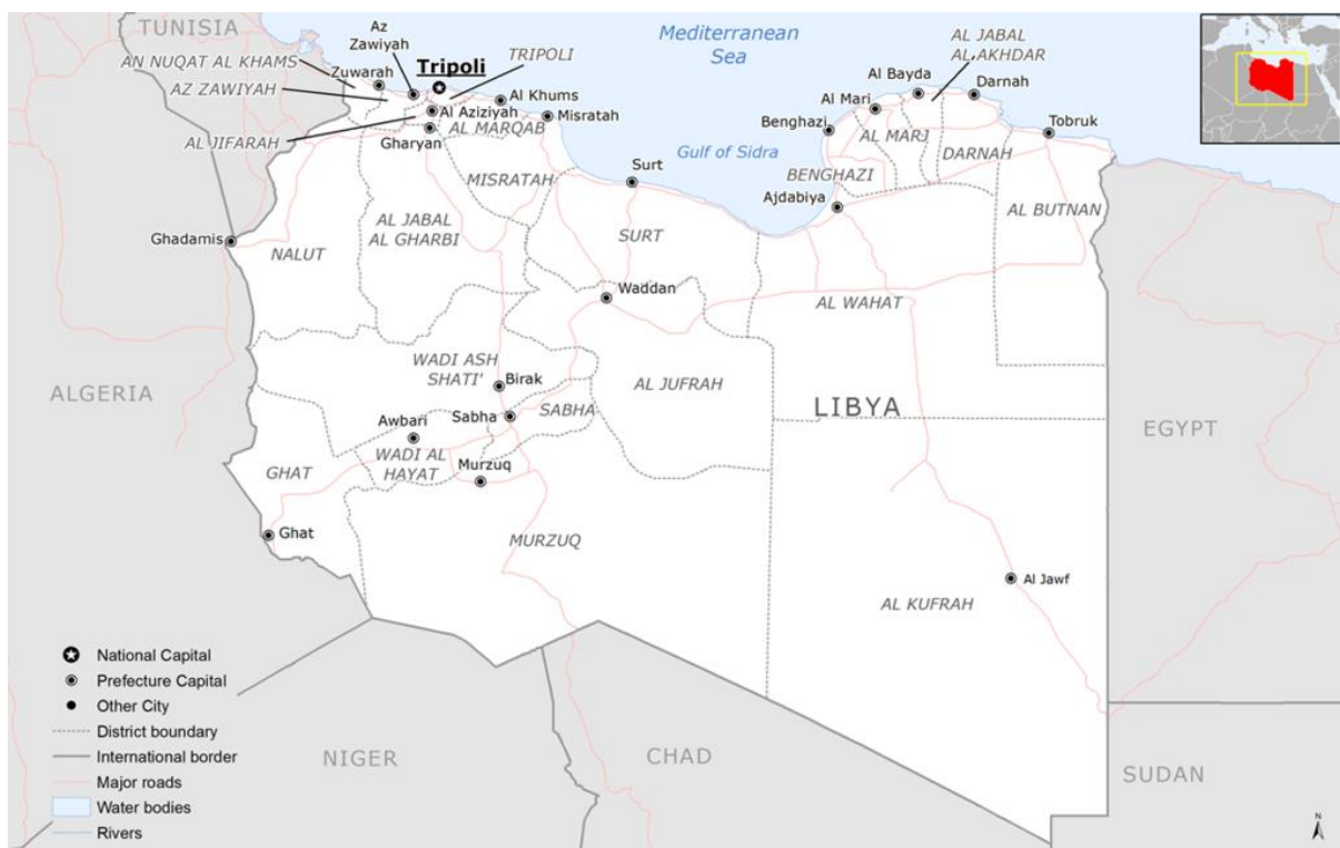
Kartta 1. Libyan valtio.

Maailmanpankki arvioi Libyan väkiluvuksi vuonna 2021 6 735 277. 62 Worldometer, joka päivittää eri maiden väkilukuarvioita jatkuvasti väestöennusteisiin perustuen, antaa 15.2.2023 Libyan väkiluvuksi 7 124 303. 63